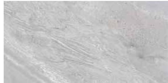
60x120 24"x48" 174 SW120SK Stone Wave Sky Honed Rettificato 60x120 24"x48" 193 SW120SKL Stone Wave Sky Levigato Rettificato