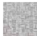
30x30 12"x12" 87 SWMTEX Mosaico Tex Mix Sky su rete * 11x