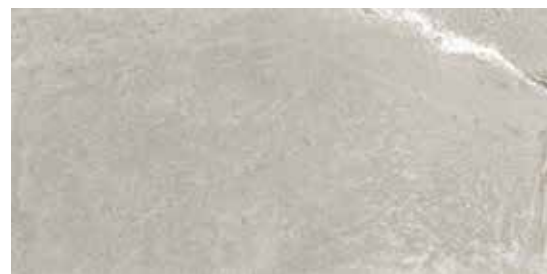
60x120 24"x48" 174 SW120GY Stone Wave Grey Honed Rettificato 60x120 24"x48" 193 SW120GYL Stone Wave Grey Levigato Rettificato