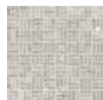
30x30 12"x12" 87 SWMTEX Mosaico Tex Mix Grey su rete * 11x