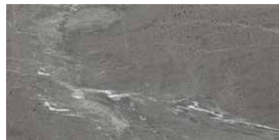
60x120 24"x48" 174 SW120BL Stone Wave Black Honed Rettificato 60x120 24"x48" 193 SW120BLL Stone Wave Black Levigato Rettificato