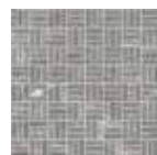
30x30 12"x12" 87 SWMTEX Mosaico Tex Mix Black su rete * 11x