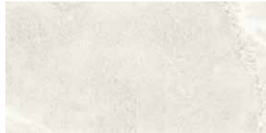
60x120 24"x48" 174 SW120WH Stone Wave White Honed Rettificato 60x120 24"x48" 193 SW120WHL Stone Wave White Levigato Rettificato